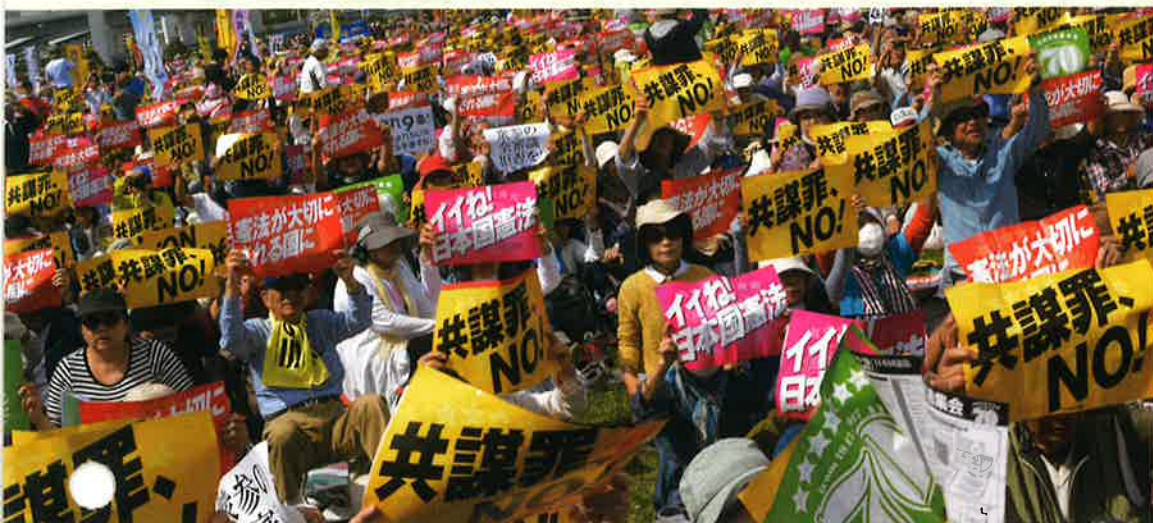
2017年「施行70年、いいえ！日本国憲法5・3集会」5万5000人参加（東京・有明防災公園）

“安倍9条改憲”反対の一点で手をつなぎましょう。3000万人の「戦争はイヤだ」の声を集めて、9条を未来につないでいきましょう。